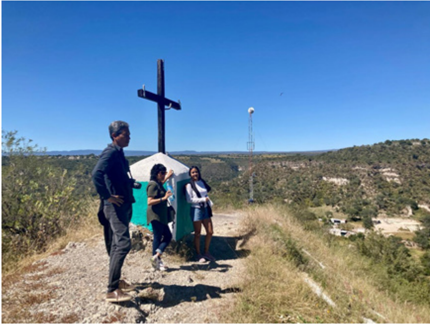
Figura 1. Fotografía tomada en el recorrido etnográfico en el Cerro de la Cruz Temacapulín, Jalisco el 28 de octubre de 2022.