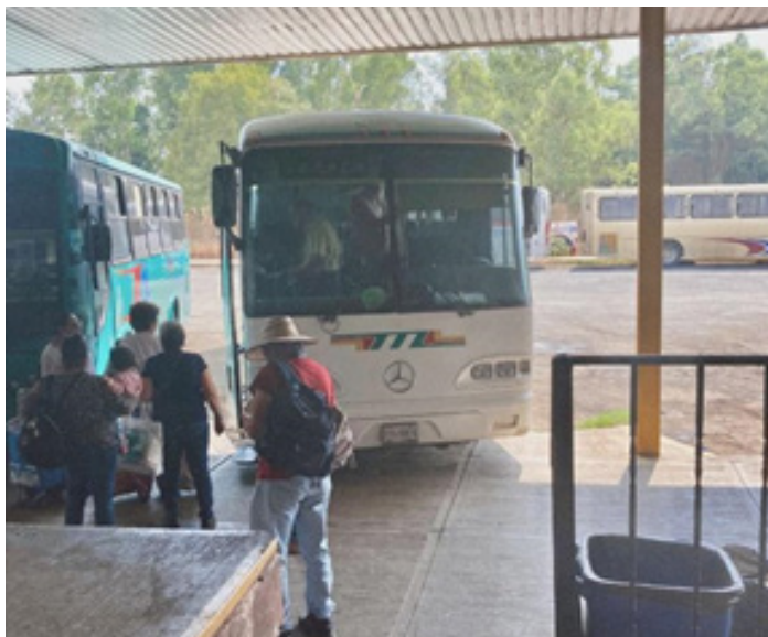
Figura 2. Fotografía tomada en el centro de autobuses de Tepatlilán, Jalisco el 28 de octubre de 2022.

Al entrevistarlas y convivir en sus espacios, tuve un acercamiento a sus vivencias, retos y sentires. Sus narraciones me llevaron a sentir y vivir esos momentos tan importantes en sus vidas; entendí el valor de la palabra memoria, y la deuda histórica que existe en la psicología en cuanto a entender las problemáticas y necesidades con una perspectiva desde las vivencias de las mujeres.